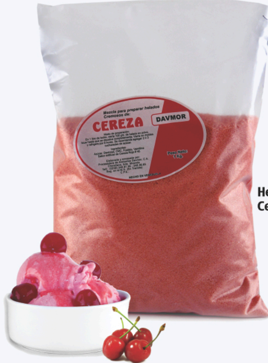
Helado de Cereza