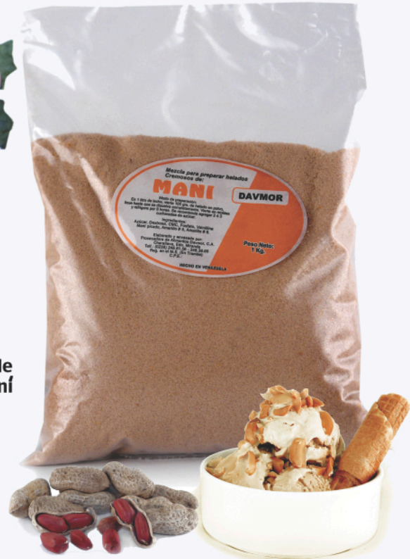
Helado de Maní