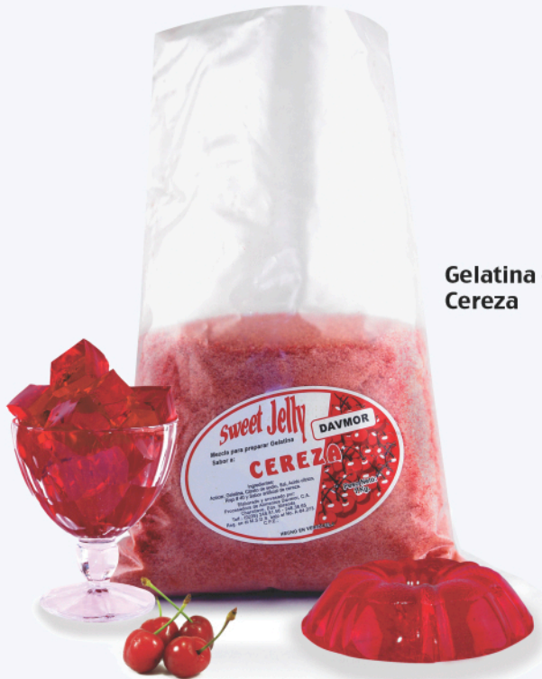
Gelatina de Cereza