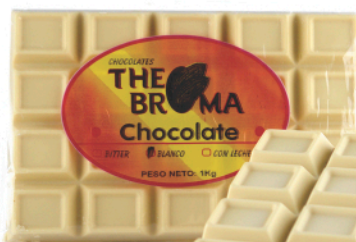
Barra de 1Kg

Presentación: Empaque de 10 Barras de 1Kg c/u Empaque de 10 Barras de 500g c/u