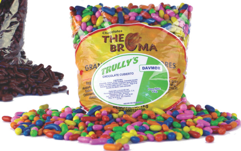
Palitos de Chocolate y Palitos de Colores (Trully's)

Presentación: Empaque de 10 Bolsas de 1Kg c/u (Por tipo de palitos)