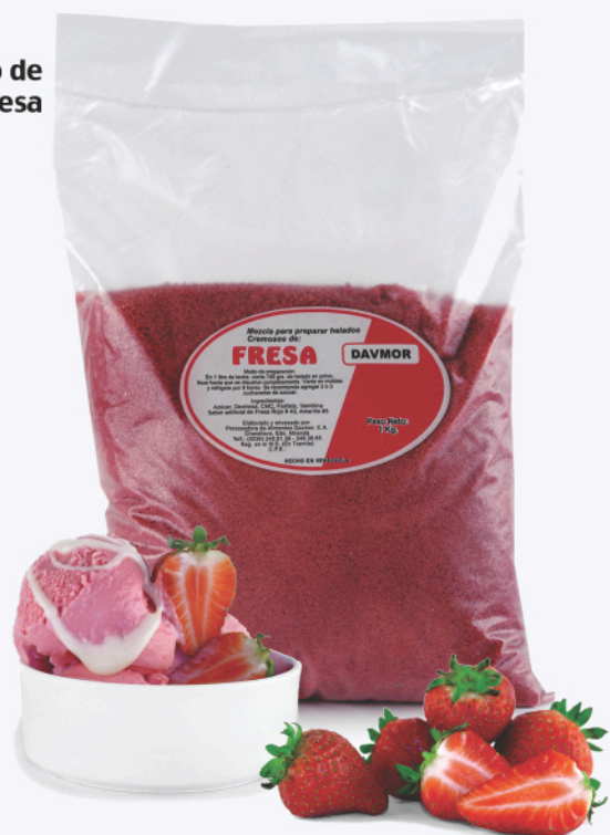
Helado de Fresa