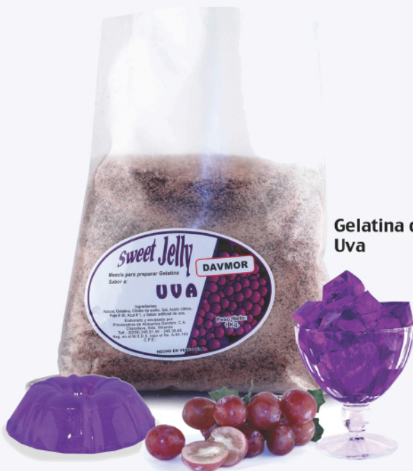
Gelatina de Uva