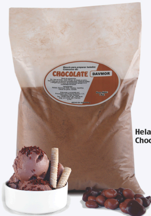
Helado de Chocolate