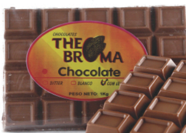
Barra de 1Kg

Presentación: Empaque de 10 Barras de 1Kg c/u Empaque de 10 Barras de 500g c/u