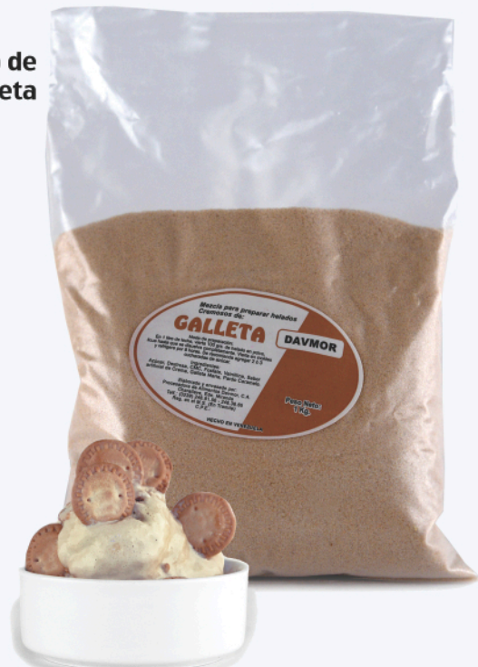
Helado de Galleta