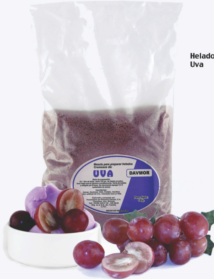
Helado de Uva