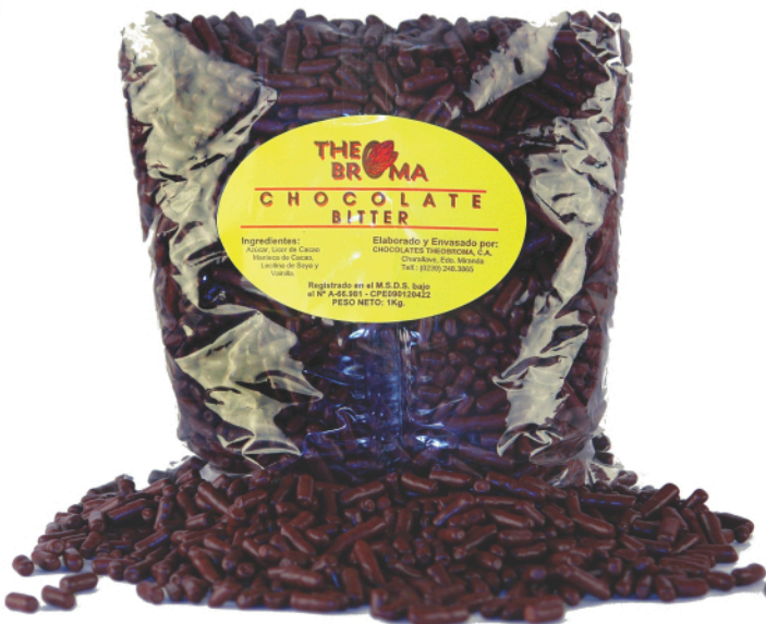
Palitos de Chocolate

Presentación: Empaque de 2 Bolsas de 5Kg c/u (por forma cuadrada o frutas)