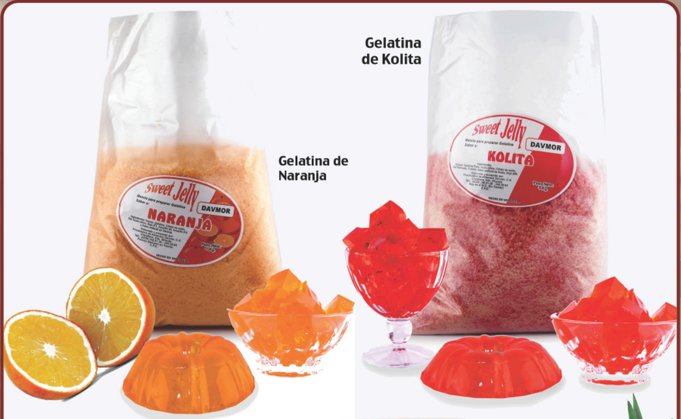
Gelatina de Kolita