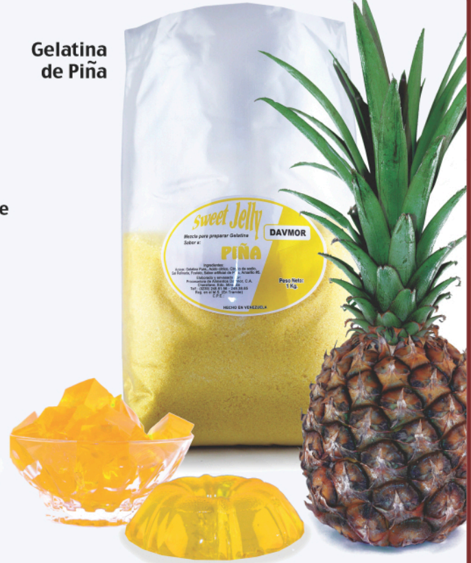
Gelatina de Piña