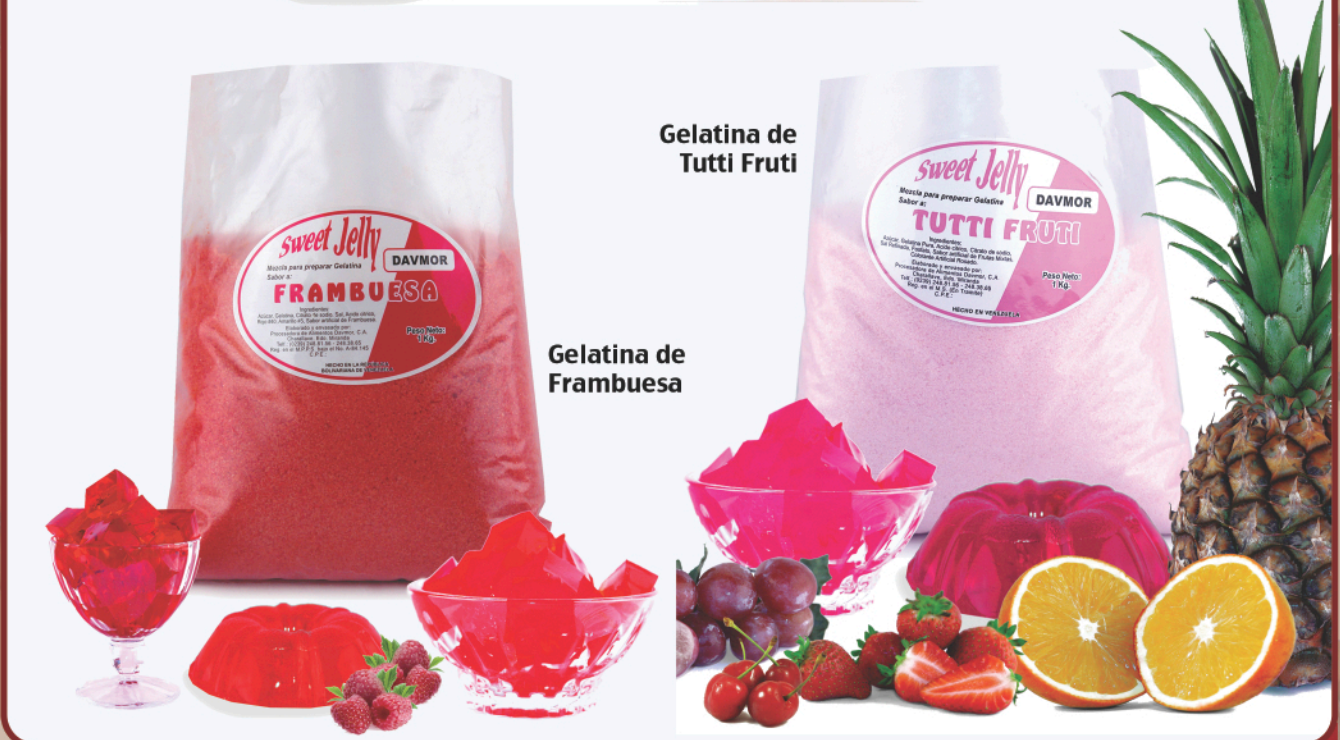
Gelatina de Tutti Fruti