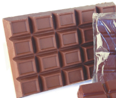
Cobertura de Leche