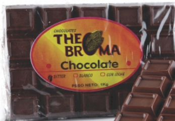
Barra de 1Kg