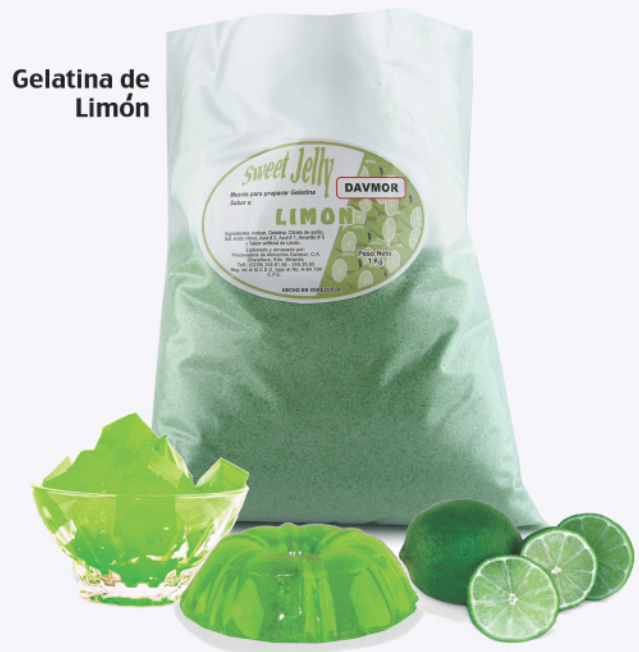
Gelatina de Limón